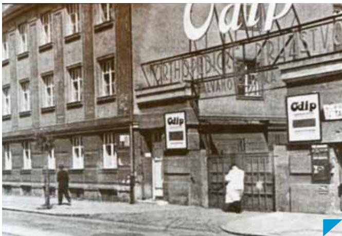
Filiálka družstva ODIP v Bratislave