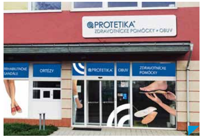
Nová výdajňa PROTETIKA Zdravotníckych pomôcok a obuv v Martine

Modernizáciu vizuálneho štýlu PROTETIKA si vyžiadala predovšetkým princíp otvorenej spoločnosti a zmena v prístupe k zákazníkom. Nové logo a vizuálny štýl PROTETIKA komunikuje otvorenosť, čitateľnosť a profesionalitu, ale predovšetkým poslanie spoločnosti, ktorým je starostlivosť o zdravie zákazníkov. Nový vizuálny štýl pre prevádzky PROTETIKY je už uplatnený a zapracovaný vo výdajni zdravotníckych pomôcok v Martine a v novej predajni v Bratislave na Bojníckej ulici v Bratislave. Postupne budú nové vizuálne prvky zavedené vo všetkých 24 prevádzkach PROTETIKY na Slovensku.