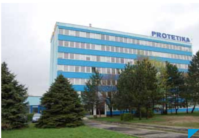
Správna budova PROTETIKY, postavená v roku 1970