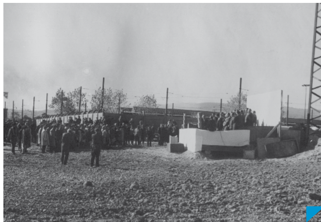
Položenie základného kameňa nového výrobného závodu