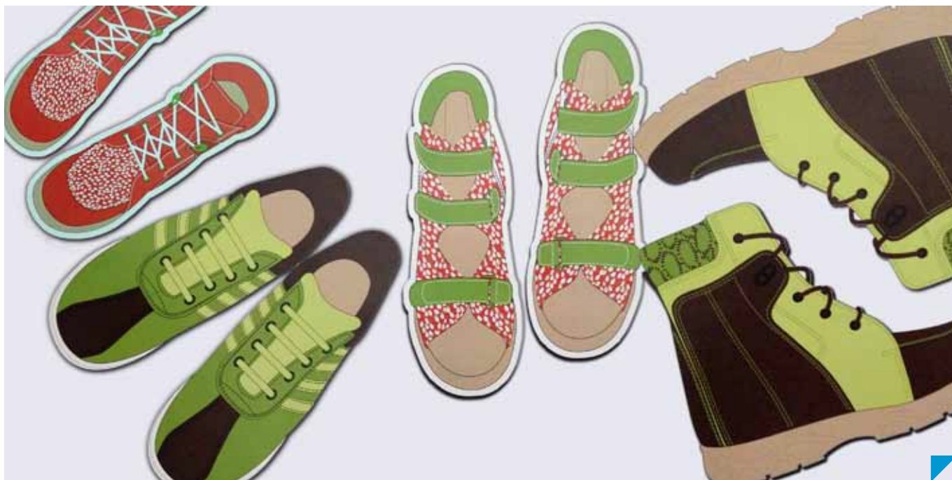
Návrhy detskej ortopedickej obuvi z Ateliéru textilného dizajnu VŠVU