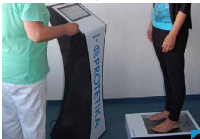
Nové skenovacie zariadenie GoMedic